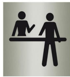
Comptoirs d'accueil, portes...