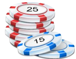
Jetons, plaques, dés...